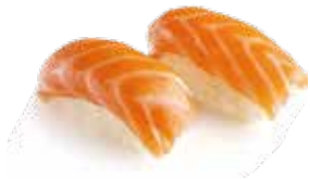
1. SAKE salmone