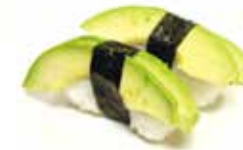
8. AVOCADO avocado