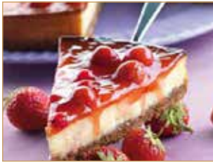
Cheesecake alle fragole € 3,50