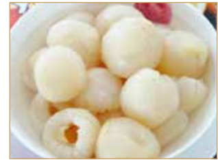
Litchi € 3,00