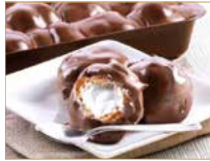
Profiterol scuro € 3,50