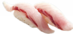
7. SUZUKI branzino