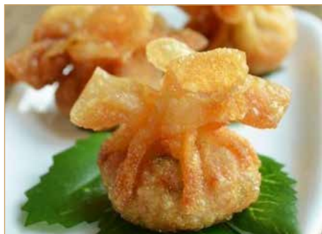
C4. 炸虾馄饨 WANTON FRITTO GAMBERI 6pz