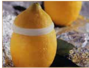
Limone ripieno € 5,00