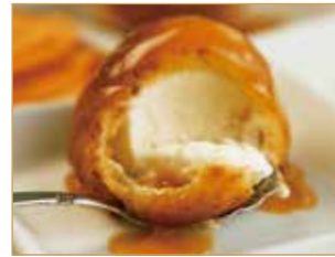
Gelato fritto cinese € 3,00