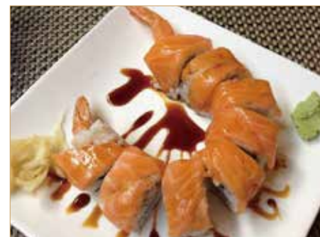
● 70. TIGER ROLL gambero* fritto e maionese, esterno pesce salmone