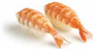
3. EBI gambero* cotto