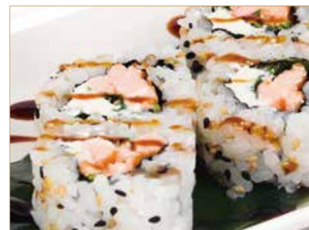
● 63. MULLA salmone impanato fritto, maionese e cipolline fritte