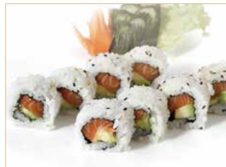
● 43. TARTUFATO SALMONE MAKI salmone, avocado con olio tartufato