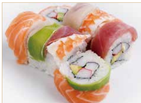
● 68. CALIFORNIA SPECIALE surimi*, avocado, maionese, esterno pesce misto, avocado e cipolline fritte