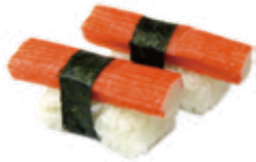
6. KANI granchio*