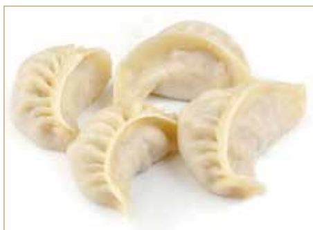
C13. 肉饺 NIKU GYOZA (6 pz) ravioli di carne al vapore*