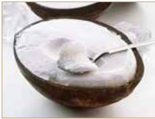
Cocco ripieno € 5,00