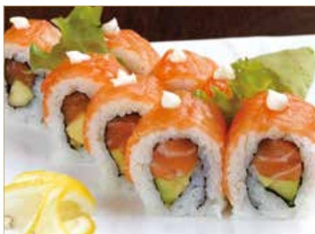
● 48. SALMONE ROLL salmone, avocado, philadelphia, esterno salmone