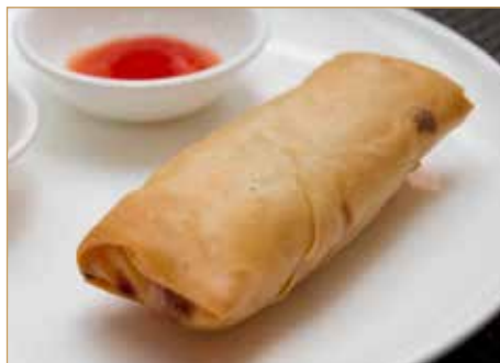
C1. 春卷 INVOLTINO PRIMAVERA 1pz con verdure