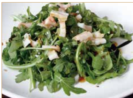
● C10. 章鱼沙拉 TAKO SU* piovra, rucola e salsa orientale