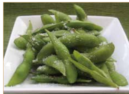
C11. 毛豆 EDAMAME fagioli di soia lessati e sale