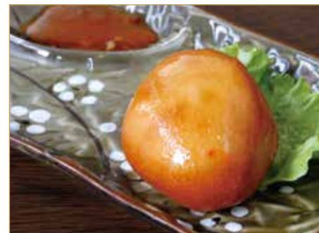
C3. 中国面包 PANE CINESE FRITTO