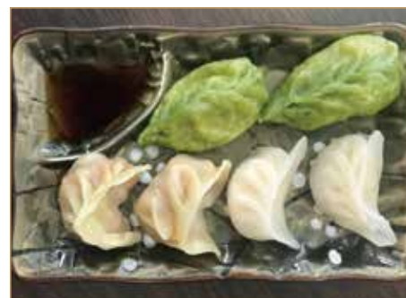
● C16. 什锦饺 GYOZA MISTO (6 pz) 2 di carne, 2 di verdure, 2 di gamberi al vapore*