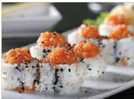
● 41. SPICY SAKE SPECIALE avocado, maionese, spicy salmone