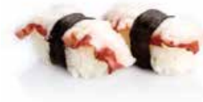
5. TAKO polipo*