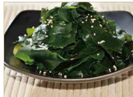
C8. 日本海带 WAKAME ciotola di alghe con salsa