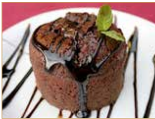
Soufflé al cioccolato € 4,00