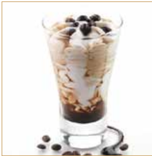
Coppa caffè € 5,00