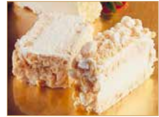
Marengo lunga € 3,00