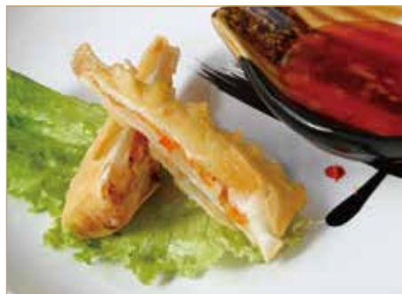
● C7. 日本春卷 HARUMAKI involtino fritto con gamberetti con verdure