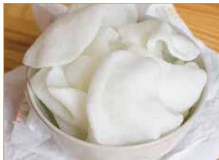
C2. 虾片 NUVOLETTA DI DRAGO