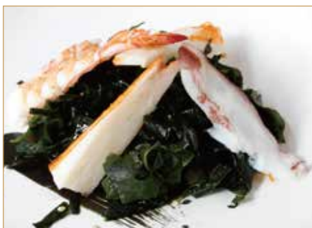
● C12. 日本海鲜沙拉 SUNOMONO pesce in aceto di riso