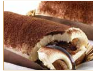
Tiramisù con savoiardi € 4,00