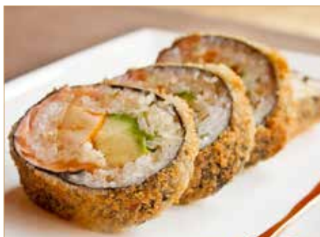
● 69. MAKI FRITTI salmone, surimi*, avocado, tobikko, philadelphia