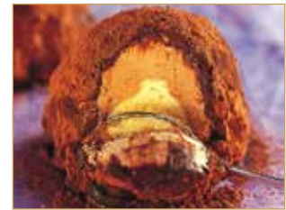
Tartufo classico / bianco € 3,50