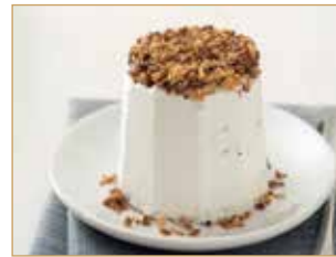
Semifreddo al torroncino € 3,50