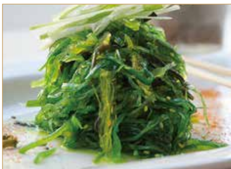
● C9. 日本辣海带 GOMA WAKAME* ciotola di alghe miste marinata poco piccante