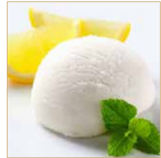
GELATO € 2,00 Crema / Cioccolato / Riso Tè verde / Limone / Cocco