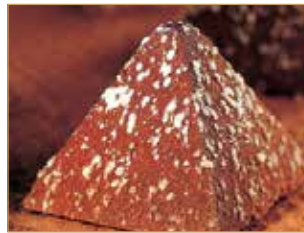
Piramide al cioccolato € 4,00