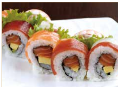
● 47. RAINBOW ROLL rotolino di salmone e avocado con pesce misto all'esterno