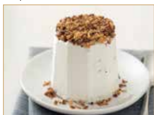
Semifreddo al torroncino € 3,00