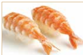
3. EBI gambero* cotto