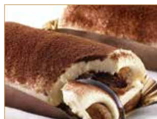
Tiramisù con savoiardi € 3,50