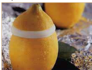
Limone ripieno € 5,00