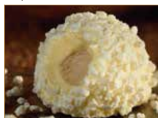
Tartufo bianco € 3,50