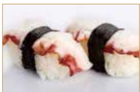
5. TAKO polipo*