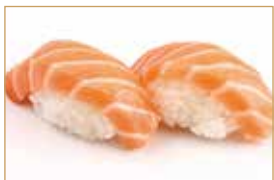
1. SAKE salmone