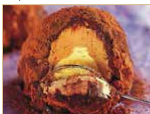
Tartufo classico € 3,50