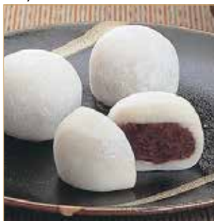
Mochi giapponese € 3,00