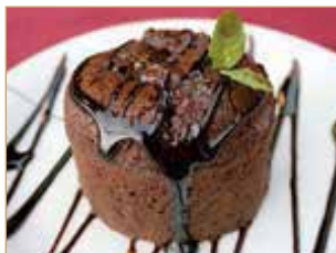
Soufflé al cioccolato € 3,00