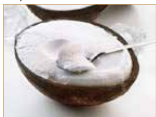
Cocco ripieno € 5,00