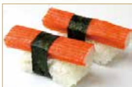
6. KANI granchio*