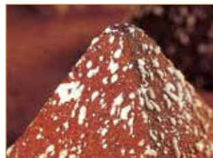
Piramide al cioccolato € 4,00