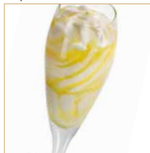
Sorbetto € 2,00