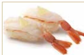
● 4. AMAEBI gambero crudo