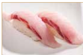
7. SUZUKI branzino