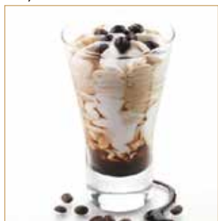
Coppa caffè € 5,00