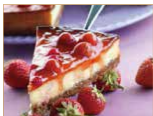
Cheesecake alle fragole € 3,00