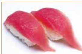
2. MAGURO tonno