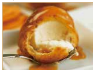
Gelato fritto cinese € 3,00