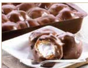
Profiterol scuro € 3,00