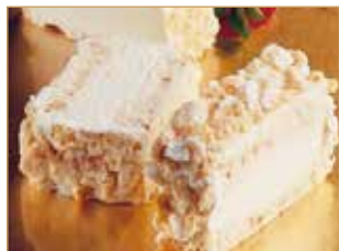
Marengo lunga € 3,00